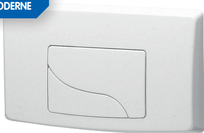
Plaque de commande 500 Blanche