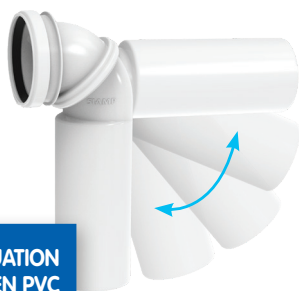
PIPE D'ÉVACUATION ORIENTABLE EN PVC