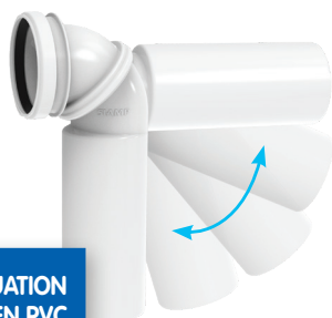
PIPE D'ÉVACUATION ORIENTABLE EN PVC