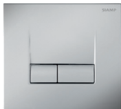
100% Aspect chromé mat clair Réf. : 31 1872 60