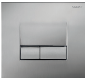
100% Brossé satiné opaque Réf. : 31 1873 60