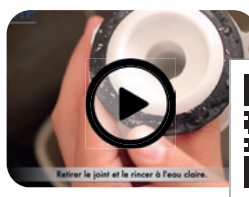
Maintenance clapet mécanisme SIAMP