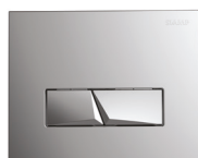
100% chromé brillant Réf. : 10 0044 05