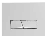
100% chromé mat Réf. : 10 0044 04