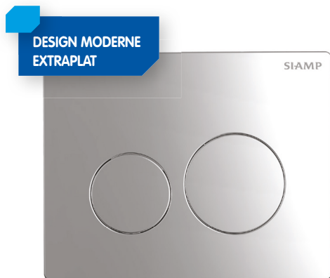
Plaque de commande Sphère Chromée brillant