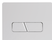
100% chromé mat Réf. : 10 0043 46