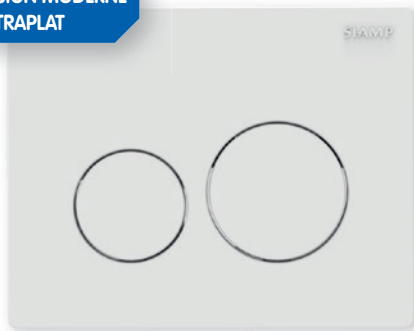
Plaque de commande Sphère blanche