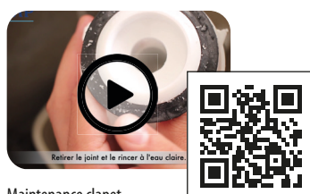
Maintenance clapet mécanismes SIAMP