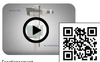
Fonctionnement robinet Quieto OD