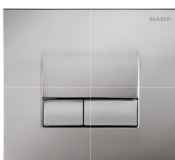
100% Brossé satiné Réf. : 31 1873 60