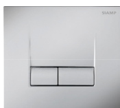
100% Aspect chromé mat clair Réf. : 31 1872 60