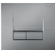
100% Aspect chromé mat foncé Réf. : 31 1879 60